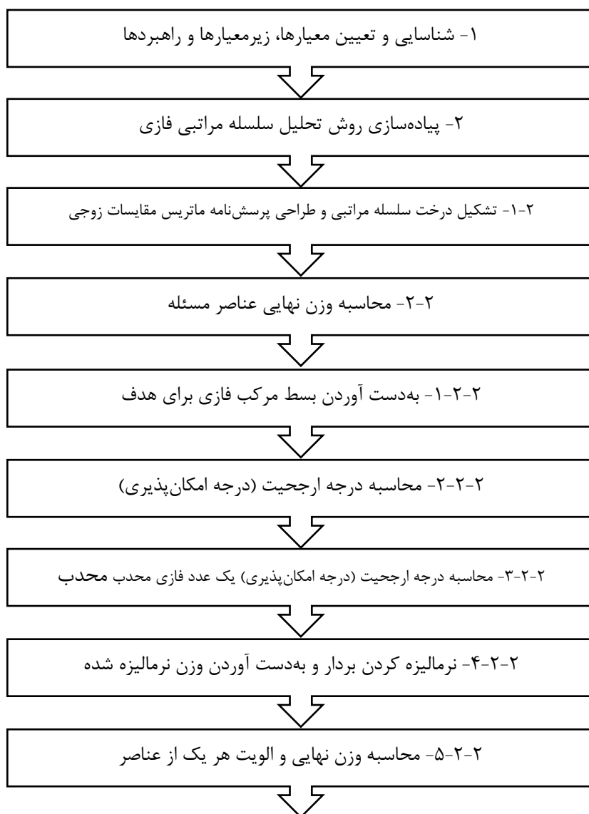
شکل ۱ - الگوریتم اجرای مطالعه

جامعه ایفا می‌کند. از سوی دیگر، شرکت‌های خدمت‌رسانی که در حوزه انرژی پاسخگوی پیش‌نیاز فعالیت‌های دیگر هستند، نیاز به توجه دوجندانی برای پایداری و تداوم از یک‌سو و کاهش اتلاف و آسیب از سوی دیگر دارند. چنان‌چه ملاحظات محیط‌زیستی و اقتصادی به‌طور هم‌زمان در نظر گرفته شود، اهمیت مسئله از دیدگاه مدل‌سازان و مدیران بیشتر می‌شود. نگهداری و تعمیرات به‌عنوان یکی از ارکان اساسی هر فعالیت به یکی از بخش‌های ضروری در دستیابی به اهداف کمی و کیفی سازمان در بحث محیط‌زیست تبدیل شده است. بنابراین داشتن یک راهبرد مشخص برای این بخش در راستای سبز از اهمیت بیشتری برخوردار است. زیرا چنین راهبردی می‌تواند نتایج و عواقب ناشی از خرابی ماشین‌آلات نظیر تولید ضایعات، انتشار گازهای سمی ناشی از سوخت ناقص، پراکندگی مواد شیمیایی خطرناک و