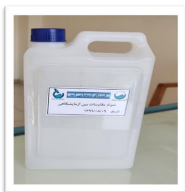
شکل ۱- نمونه‌های فرعی آماده شده جهت انجام آزمون فیزیکیوشیمیایی آب

تمامی آزمایشگاه‌های شرکت‌کننده ملزم شدند که حداکثر ۲۴ ساعت پس از دریافت نمونه، آزمایشات مرتبط را انجام دهند و در این مدت باید شرایط محیطی نمونه رعایت شود که طی دستورالعمل‌های تدوین شده، از قبل به اطلاع آزمایشگاه‌ها رسید. همچنین آزمون پایداری ۷۲ ساعت پس از آزمون اصلی برای کلیه آزمون‌های انجام شد و در صورت انحراف در محاسبات آماری لحاظ گردید. بنابراین، ضمن رعایت شرایط حمل و نقل، نیازی به تثبیت نمونه‌ها نیست.