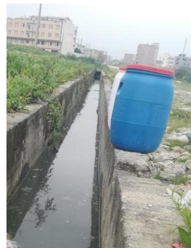
شکل ۱- محل تهیه آب خاکستری، مخزن عمل‌آوری و مصالح و تجهیزات مورد استفاده

سنین مختلف آزمون‌ها به ترتیب در عیارهای مختلف سیمان و سطوح مختلف زئولیت است. به طریق مشابه غیرمعنی‌داری برهمکنش چهارگانه عیار سیمان در نوع آب در زئولیت در سن آزمون نشان می‌دهد که عیارهای مختلف سیمان در انواع مختلف آب و در شرایط مورد بررسی کاربرد زئولیت تاثیرگذاری مشابهی بر مقاومت فشاری آزمون‌های بتنی در سنین مختلف دارند. بنابراین در بخش بعد صرفاً نتایج مقایسه میانگین منابع تغییری که موجب اثر معنی‌داری بر مقاومت فشاری آزمون‌های بتنی شدند، ارائه می‌شود.